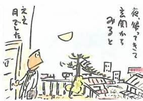
2001年 母へ送った絵手紙